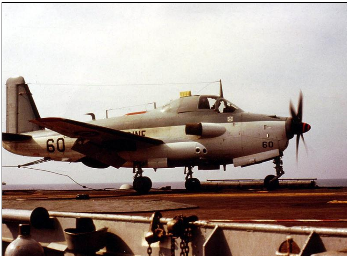
Le Breguet Alizé est un appareil imposant, embarqué sur les porte-avions.

Le Breguet Alizé a œuvré pendant 40 ans dans la Marine Nationale, pour la lutte anti-sous-marine et de surveillance maritime, la plupart du temps embarqué sur les porte-avions français.