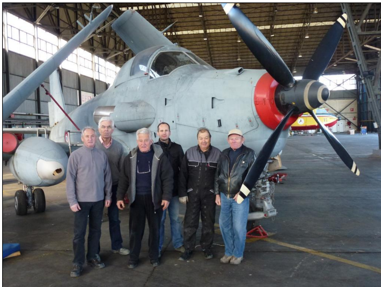
La première équipe de démontage devant le Breguet Alizé à Nîmes